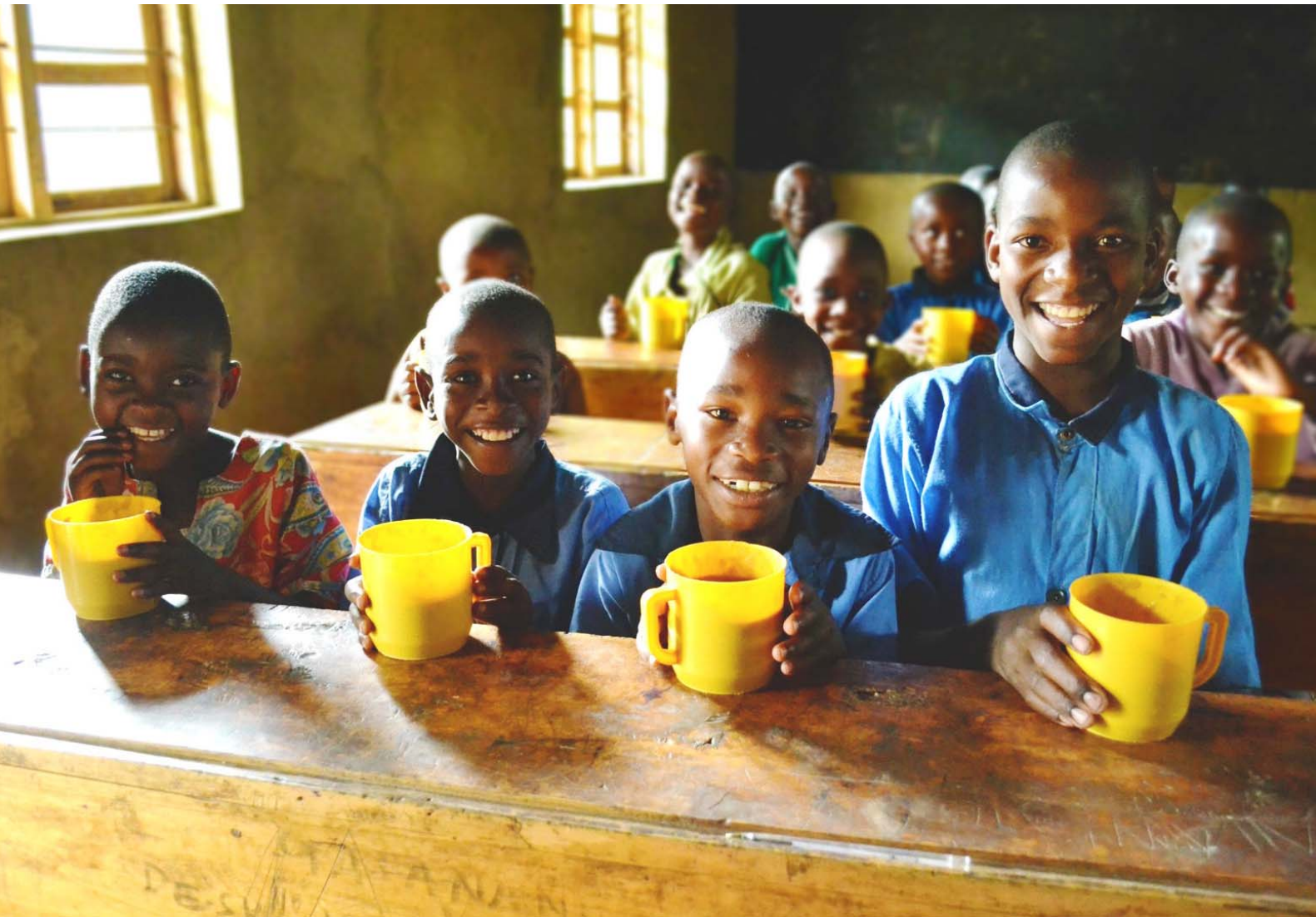
TABLE FOR TWO