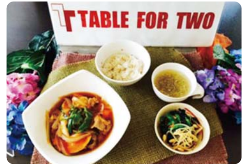
トヨタ自動車㈱ 食堂でのヘルシーメニュー 「野菜たっぷり黒酢酢豚&ほうれん草と豆もやしのナムル&五品目野菜スープ&五穀米」