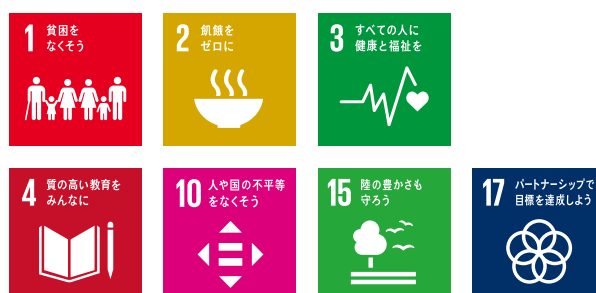
TABLE FOR TWOは、SDGsが掲げる17の目標のうち主に7つに貢献します。

SDGs (持続可能な開発目標) は、2015年9月に国連加盟国193か国が全会一致で採択した行動計画。貧困や飢餓、平和的社会など17目標から成り、2030年までに目標を達成することを目指しています。