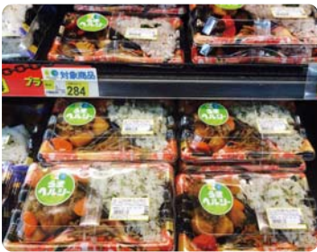
㈱若菜 寄付つきのお惣菜を西友で販売