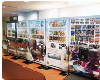
野村證券㈱ 食堂で寄付付きのラッピング自販機を設置